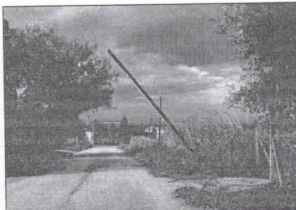
Il palo piegato sulla carreggiata

L'azienda italiana di telecomunicazioni è già intervenuta ad eliminare il pericolo in pubblica strada, ma ancora necessita di ulteriore e definitivo intervento risolutivo. Una problematica, in realtà, segnalata da più fronti. Di recente, il gruppo di opposizione «Rinascita per Zambrone» ha provveduto sia a mezzo Pec sia telefonicamente a comunicare il pericolo alla Telecom.