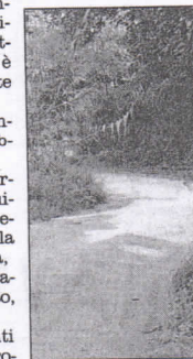
Lo stato di abbandono

tente» Provincia di Vibo Valentia. Il tratto di strada in questione è un'arteria storica di collegamento dei tre centri delle Preser-